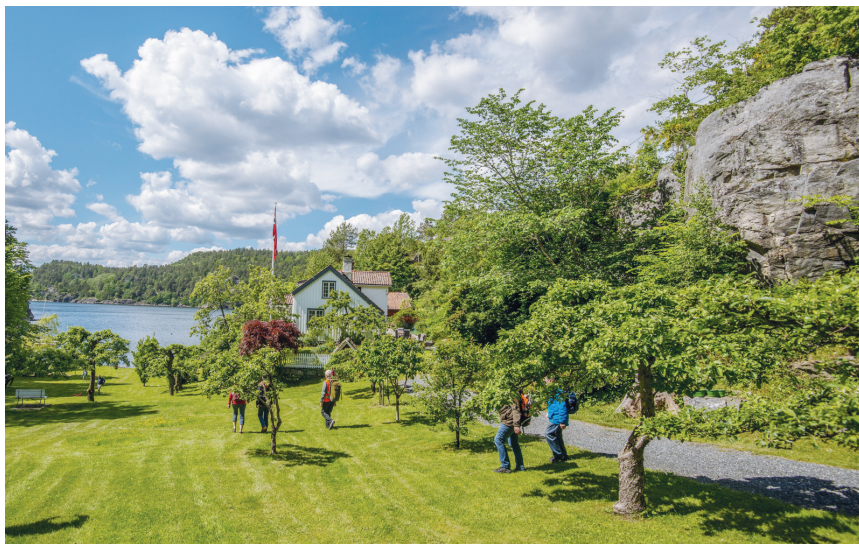
Siste stopp var Hellerskilen der Christian Wintermark fortalte om stedets historie.

Etter å ha passert sementstøperiet fikk vi et flott skue utover byen fra toppen av Krantrappene.