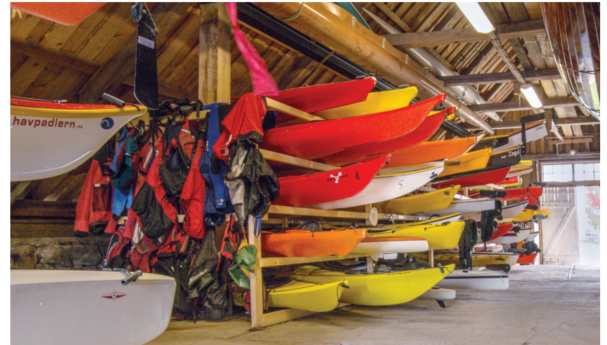
Interiøret i Mudderbua, der Risør Ro- og Padleklubb holder til med sine båter.