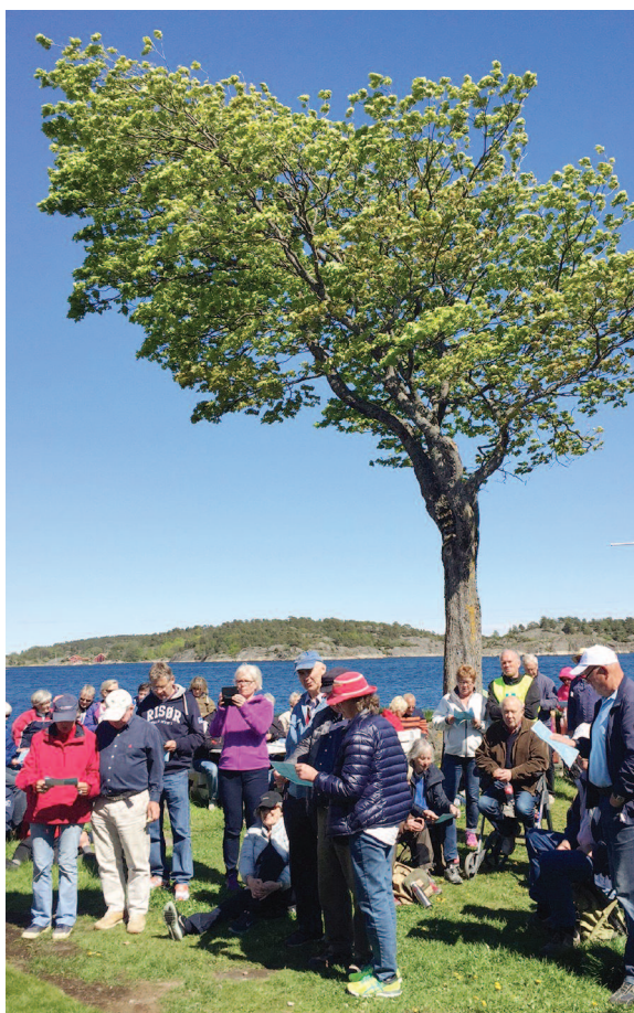
På Kastellet måtte vi jo synge «E og Mary»!