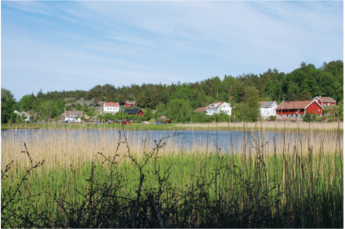
Åkvåg-gårdene fotografert fra vest.