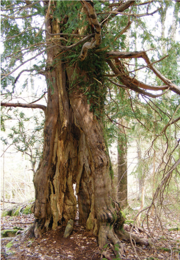
I Østerdal er det næringsrik jord og gode klimatiske betingelser. Her finnes ei kjempestor – og gammel – barlind.