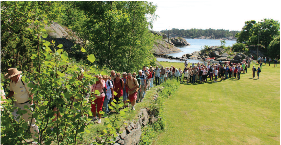
Hovedrasten var i Ønnvika, hvor det var god plass til alle!