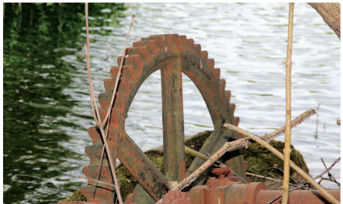
Deler av maskineriet til kjerraten står fortsatt, om enn i nokså dårlig stand.

Ferden gikk deretter opp Linderapet, vi fulgte den nye bilveien et stykke for så å gå det gamle tråkket opp til Sundsdalsmyra.