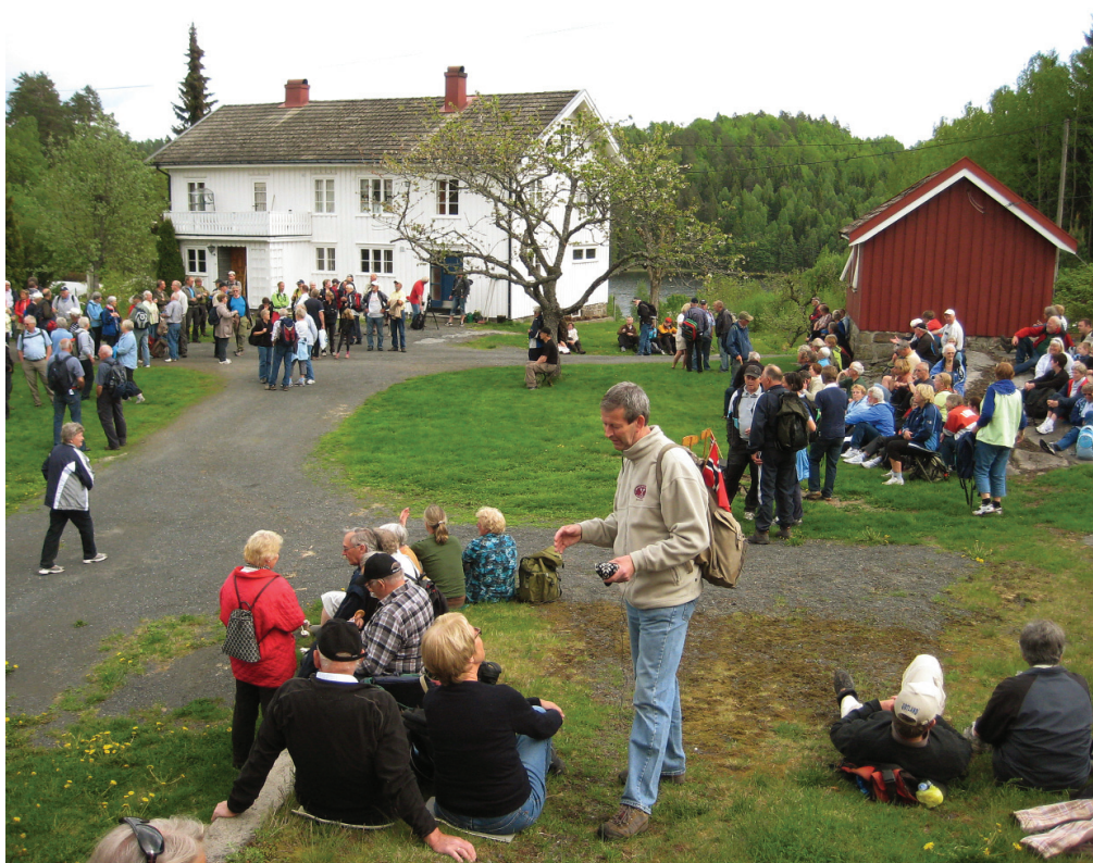
På nedre Lindland ligger to gårdsbruk tun i tun. Her ble vandringsturen avsluttet med fortelling om gårdene fra 1600-tallet og framover.