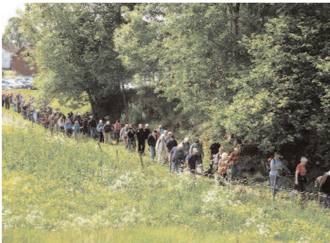
Første etappe fra Sjøvåg til Solheim gikk gjennom fint beitelandskap.