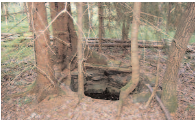
Brønnen i øvre Glupe er ett av de få sporene som er igjen på plassen.

Fra øvre Glupe gikk en ned bakkene til Dalsvann og fulgte traktorveien til Sjøvågstranda. En gikk så til Dale, gjennom tunet på Oddvar Dales gård fram til tunet hos Olav Dahle.